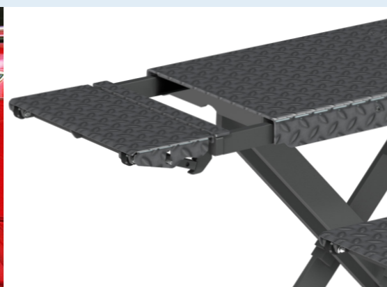
Nuova massima estensione a 2.320 mm con le pedane estensibili. (Versione X-Tend)