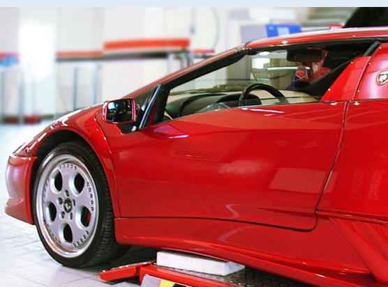
Pedane molto basse: perfetto per vetture sportive

JUMBO LIFT 3500, 4000: OFFRIAMO LA GIUSTA PORTATA PER OGNI AUTOFFICINA