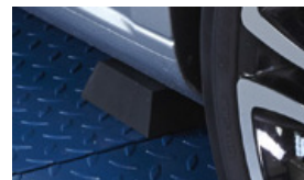
Tamponi a troco di piramide