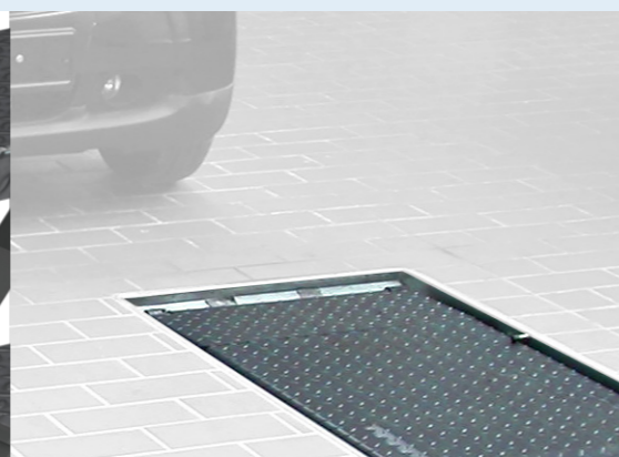
Versioni per installazioni a pavimento o ad incasso per veicoli con altezza ridotta, idealmente con il telaio da incasso zincato opzionale