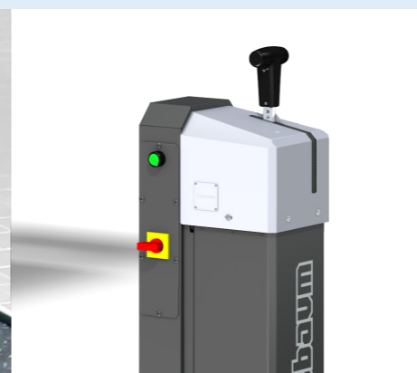
La leva di comando Nussbaum permette il controllo della velocità di discesa. (Versione X-Tend)